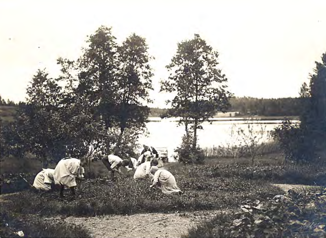
■ Marjanpimintaa puutarhassa.