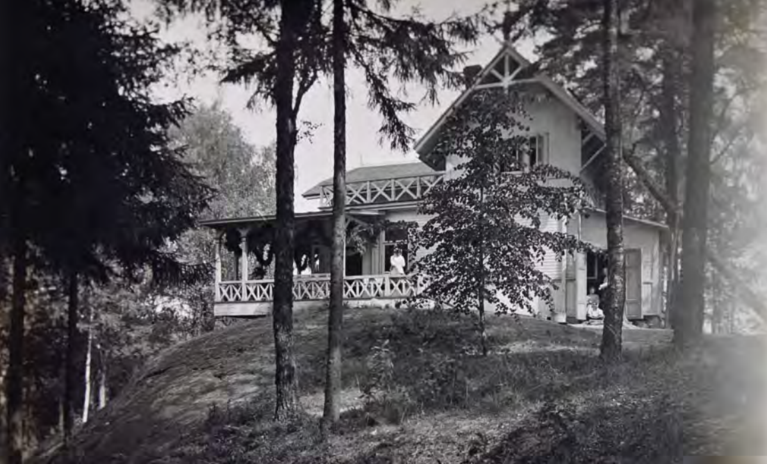
■ Uusi huvila rakennettiin kauniille kalliolle. Kuva Artur Faltin, 1900-luvun alku, Museovirasto.