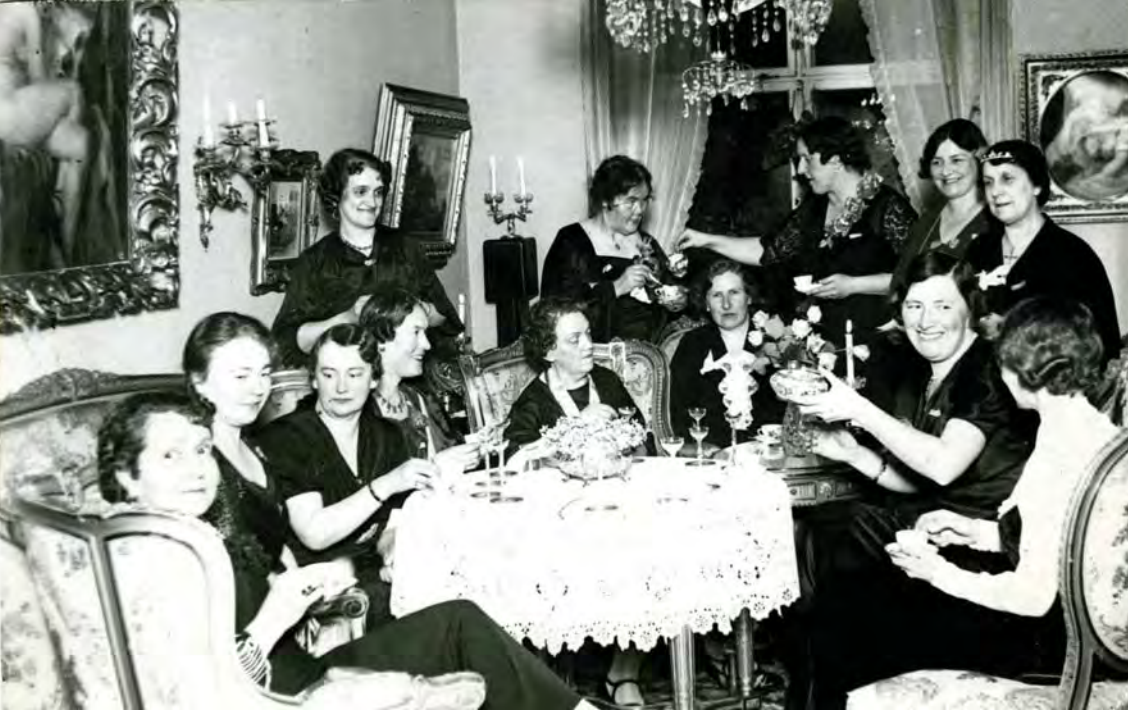
■ Vikanin ompeluseuran naiset.