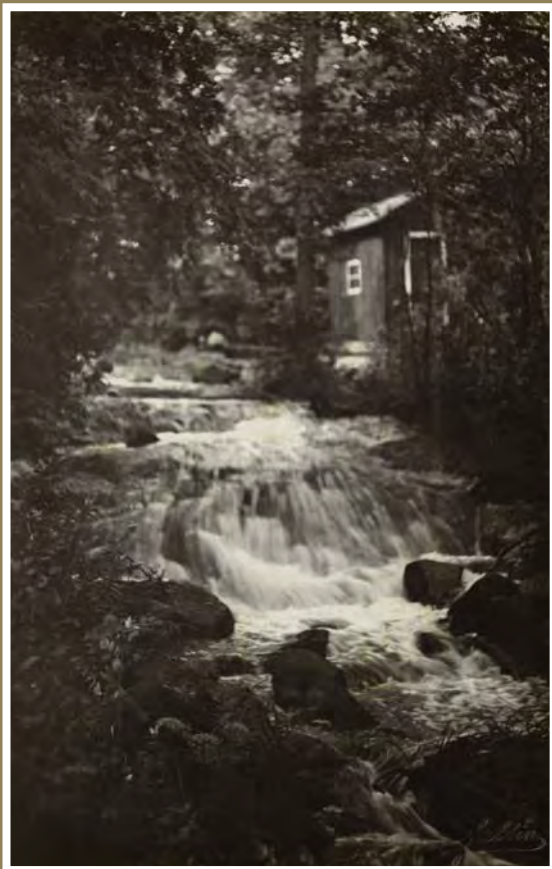
■ Kuva Richard Faltinin kokoelma, Kansalliskirjasto.

napuoloja hohtavat rinteet järven rannikon / Kesä kultainen hyvästi jää! Jo syksy saapunut on.”