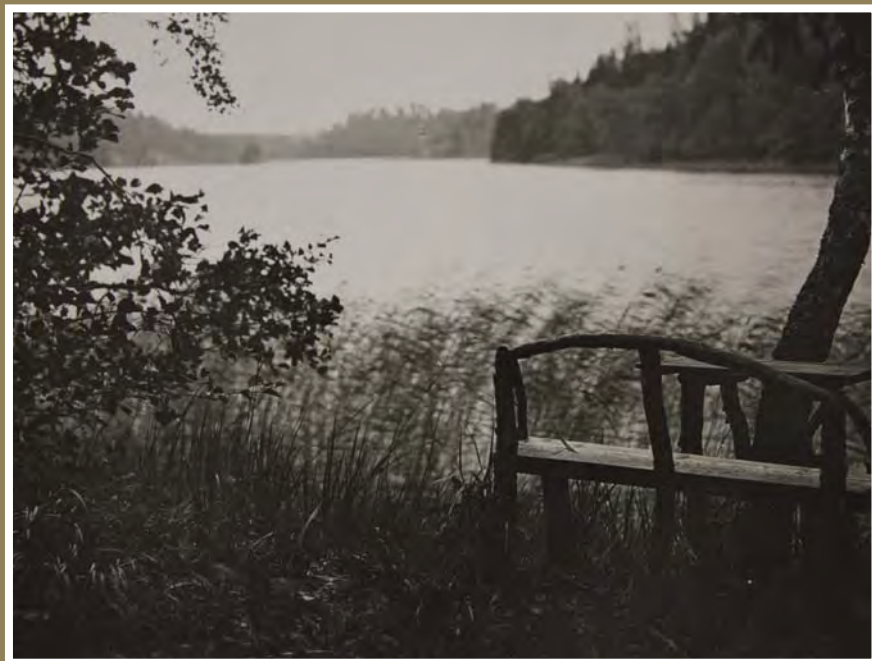
■ Rannan pöytä ja penkki, joiden ääressä Wegelius toisinaan sävelsi.