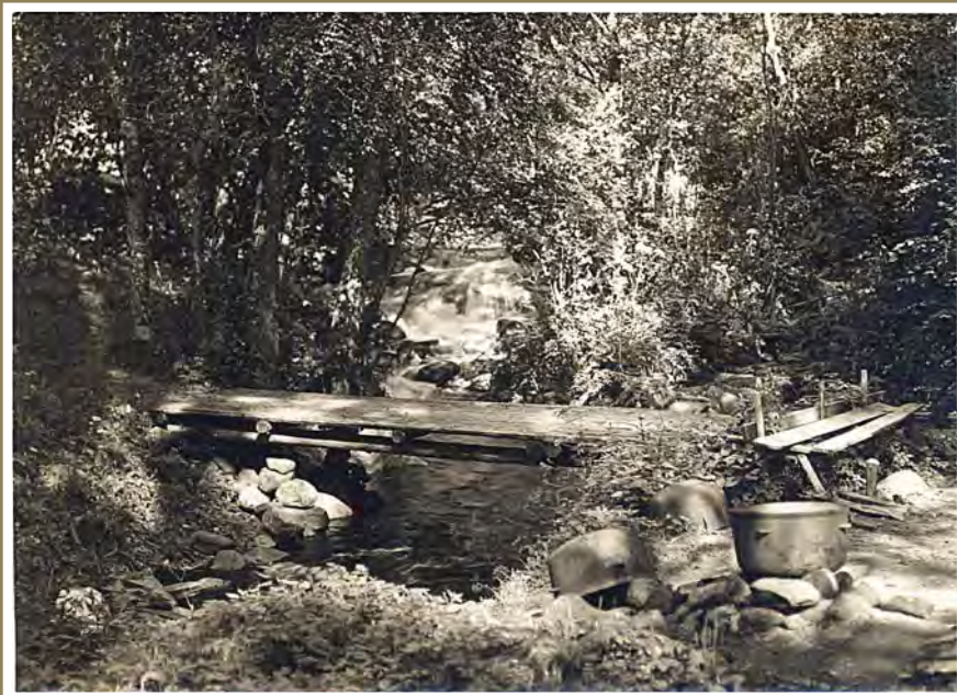
■ Puron putous ja pesupaikka.