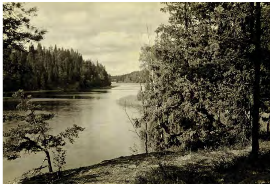
■ Kuva Richard Faltinin kokoelma, Kansalliskirjasto.