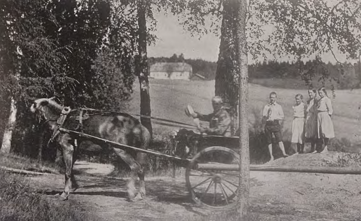
■ Robert Kajanus saapuu hevosella vierailulle Vikaniin.