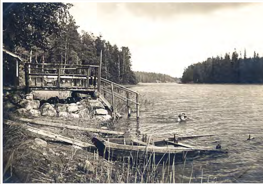
■ Virkistystä jär- vessä.