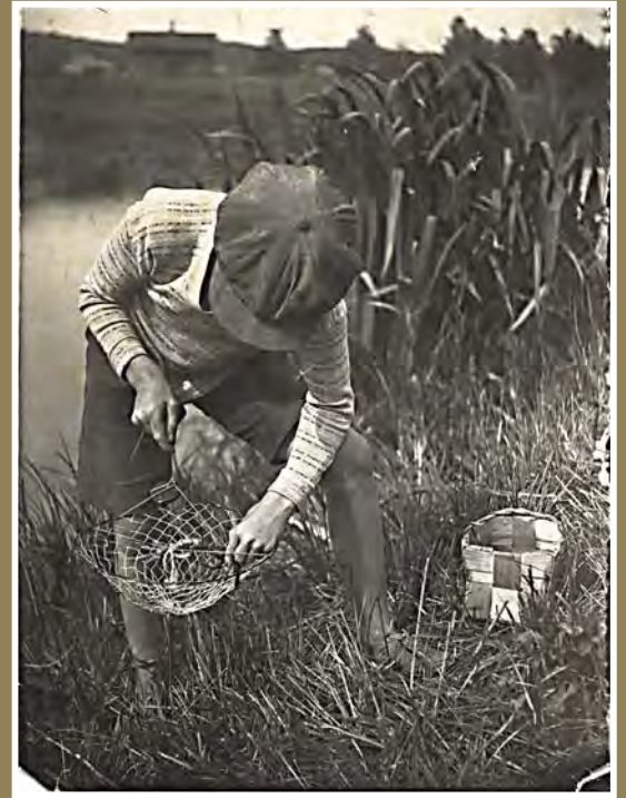
■ Syyskesällä ravustettiin.

Kesällä 1922 vieraili Minna Talwik ja 1926 Ilmari Krohn ja Hilja Haahti, joka runoili: ”Jo tähdet syttyvät yllä honkien holviston / pu-