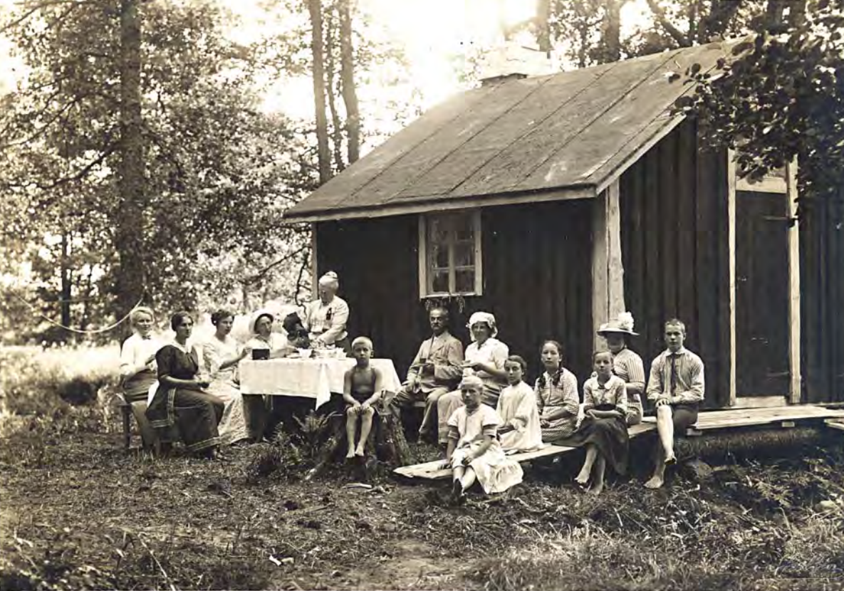
■ Vikanissa vieraili myös koululaisia.