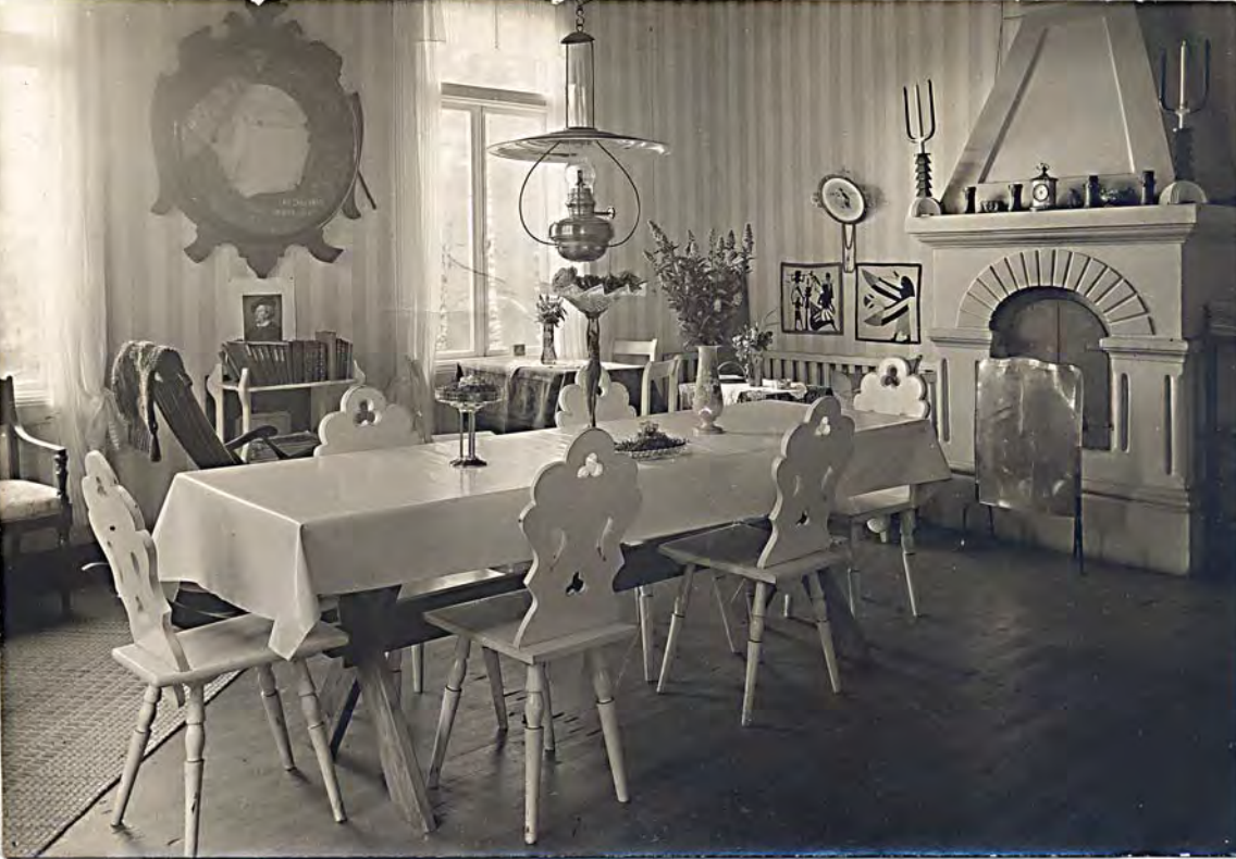
■ Vikanin sali. Seinällä Wegeliuksen 50-vuotis-seppele.