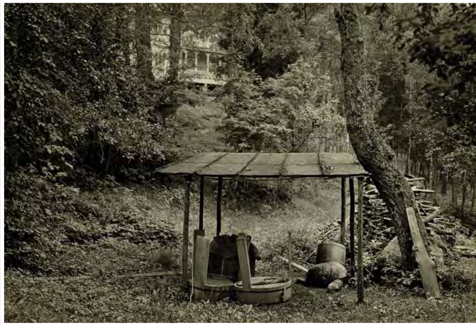
■ Yksinkertainen pesupaikka pihalla.