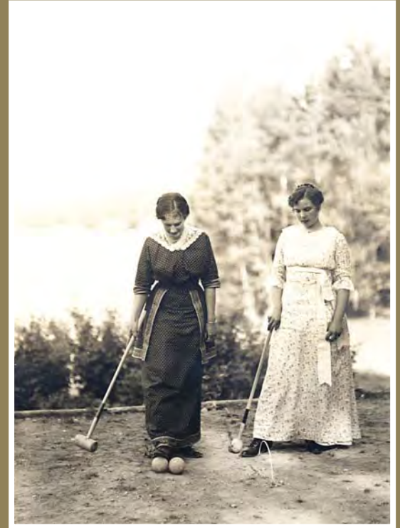
■ Kesäistä liikuntaa Vikanissa.