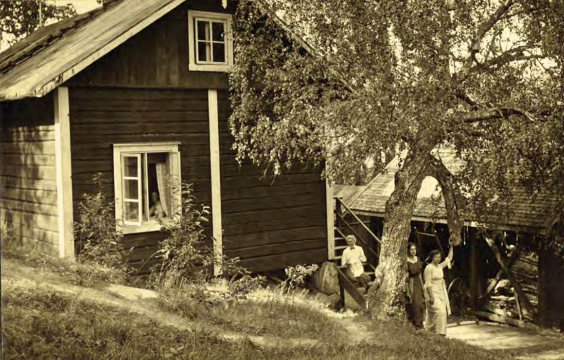
■ Kaksikerroksinen tuparakennus ja pärekattoinen puuliiteri.