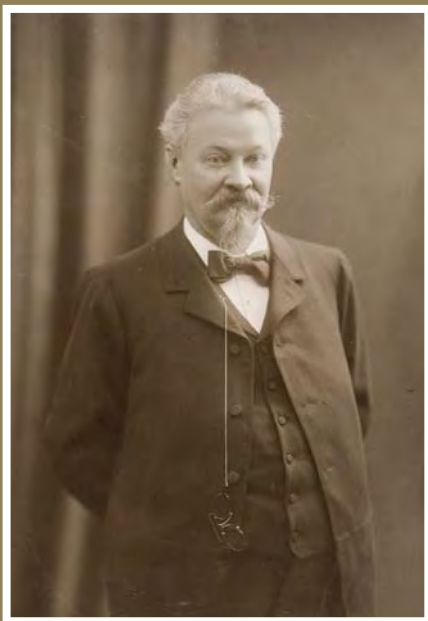
■ Martin Wegelius

bölen rusthollin alaisuudessa. Myöhemmin palsta lohkottiin Persbölen Yttergårdin verotilan maista. Vanha huvila sijaitsi nykyisen päärakennuksen ja kallioisen mäenrinteen alapuolella sisäänajotien vasemmalla puolella.