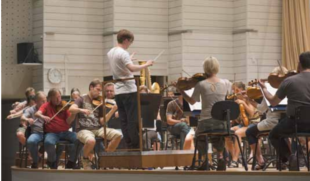
Pietari Inkinen harjoittaa Mahlerin ensimmäistä.