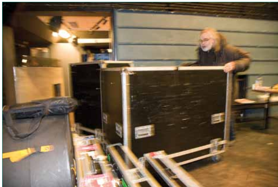
Hammondin roudausta. ”Tasaisella menee hyvin yksinkin, kun on kunnan kuljetuslaatikko ja pyörät alla. Toiseen kerrokseen viettäessä tarvitsee jo apuvoimia.”

Oikeastaan molemmat puolet vaikuttivat asiaan. Minä tutkin ja kuun-