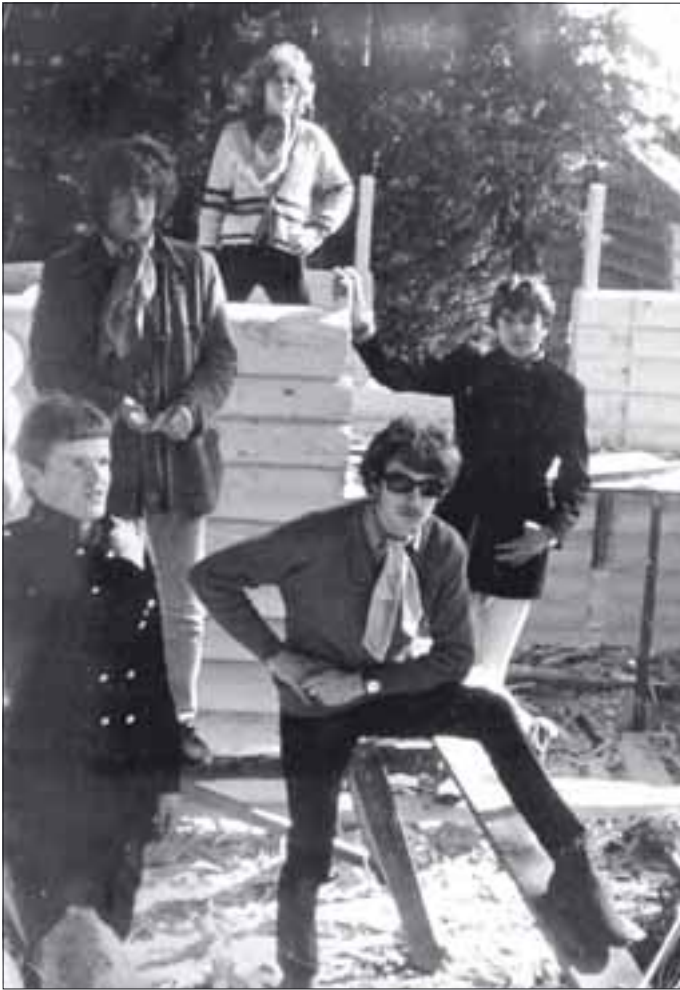
Jyväskyläläinen Silvery joskus 60-luvulla.

”Tein yksitoista kuukautta töitä ihan sen kuuntelun kanssa, pitkiä päiviä yksin kellarissa.”