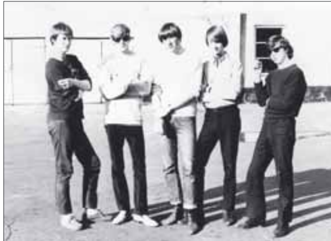
Nybergin ensimmäinen bändi oli The Steeples.

”Kehitys näkyy tässä niin hyvin: ensin oli rautalanka, johon sitten tuli laulu mukaan, sen jälkeen rock, ja sitten muuta.”